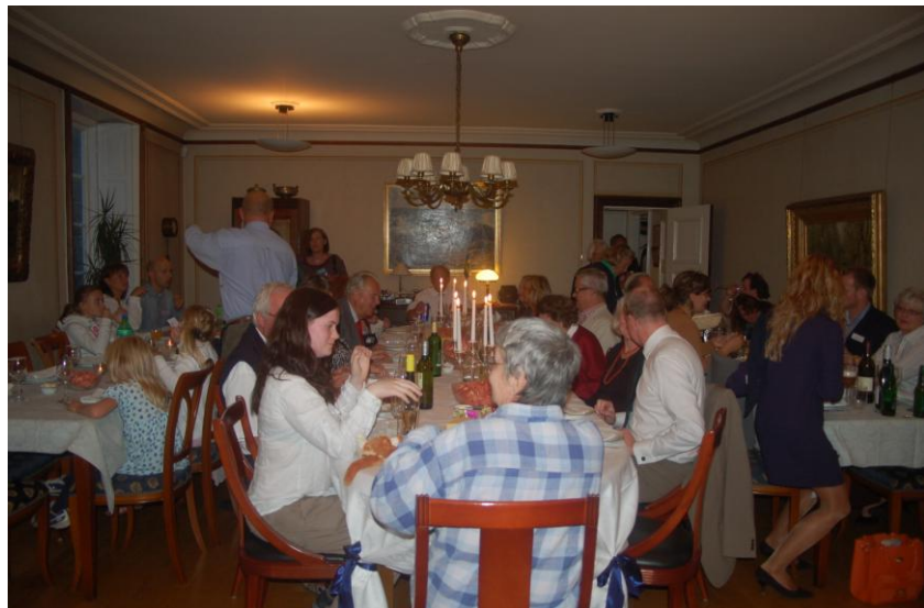
Räkfrossa i Caroline Wijks Sjuksköterskehem