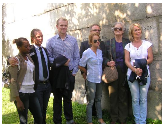
Baron Oscars grav och ättlingar

William läste orden: "Good morning, this is God. I will handle all your problems today, and I don't need your help. So, have a good day!"